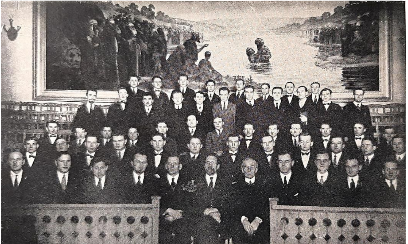
Rīgas Misionāru Bībeles Apmācības skolas studenti un skolotāji

"Kad kopā esat apmetušies, tad jūs spīdīet kā baložu spārni ar sudrabu apklāti, un kam ir spalvas kā zaļgans zelts." Psalmis 68:13