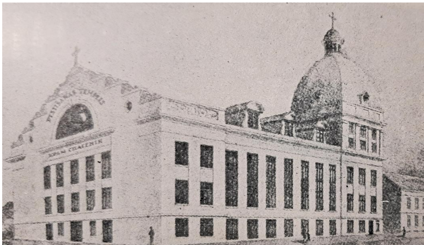
Pestīšanas Templis, Rīga