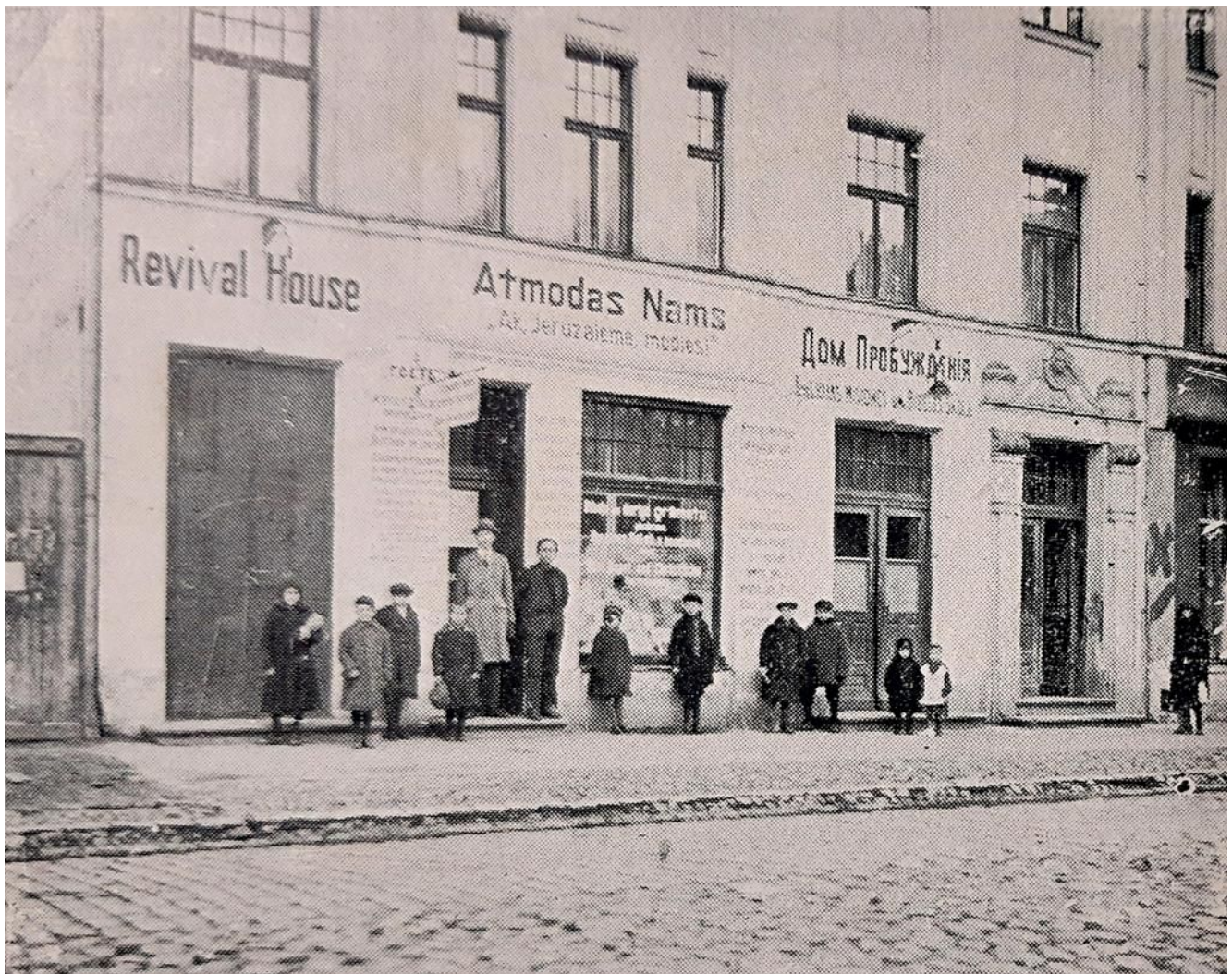
Atmodas Nams, bijušais kinoteātris, kur sākās darbs Rīgā 1923.gadā

Ir laiki Dieva Draudzē, kad ir jāpārstāj sludināt un pat lūgt vai izstādīt Dieva Likumu plāksnes; kad kādam, patiesi, ir jāsaģrābj tas zelta (elka) teļš, tas jāsašķaida un jāizkaisa uz visām pusēm. Kad tev no Tā Kunga Vārda (Sv.Rakstiem) ir skaidrs tas, kas ir tavš pienākums, tad vēl lūgt par to, kas varētu būt tavš pienākums ir nevietā. Ir laiks, kad kopā ar Mozu ir jāsauc: "Kurš ir Tā Kunga pusē?" un ir laiks, kad ir jānotiek skaidrai dievbijīgo atšķiršanai no bezdievjiem. Nevienš nevar palikt šāda veida kompromisā.