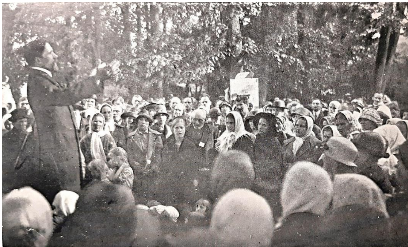
Evaņģēlija sludināšana Parkā, kuru izveidojis Pēteris Lielais, Rīgā, Latvijā. Tādas sapulces tika noturētas svētdienu pēcpusdienās vasaras mēnešos.