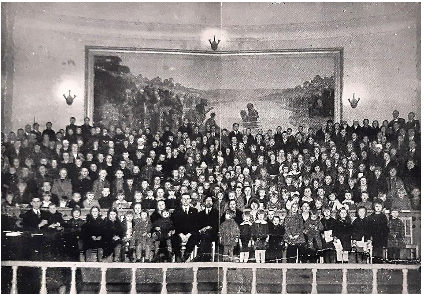
Pestīšanas Tempļa svētdienas skola

Un trešā – stingri ievērot pamatprincipu par "Ahana" iznīcināšanu no Nometnes, lai nodrošinātu ieguvumu, kas nāk no pirmajām divām patiesībām.